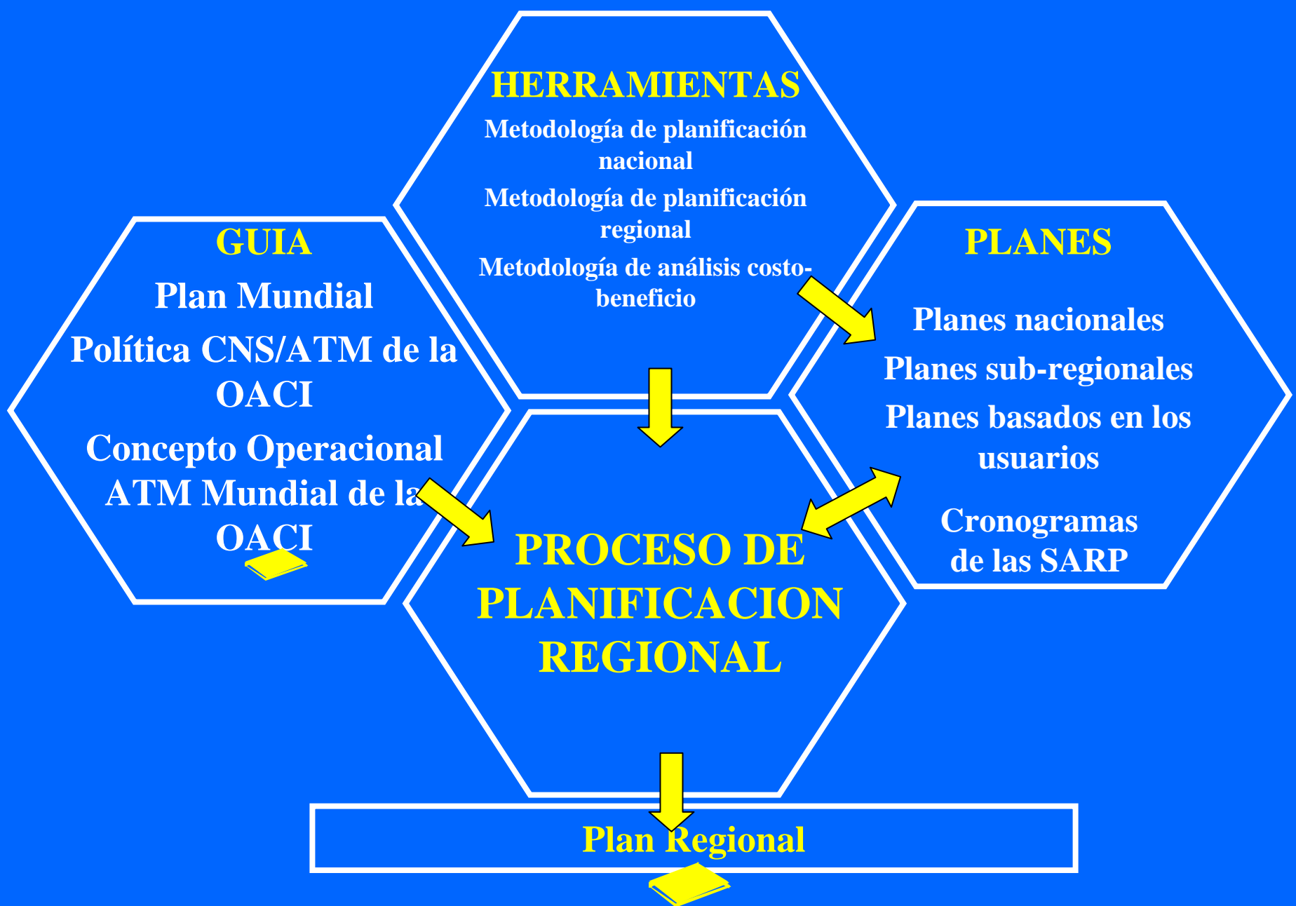
Proceso de planificación a nivel regional